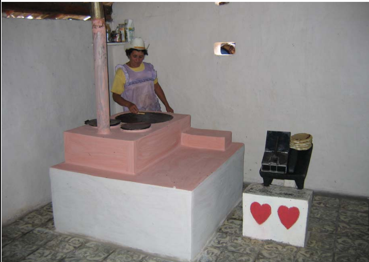
PROYECTO TIPO Estufas ahorradoras de leña