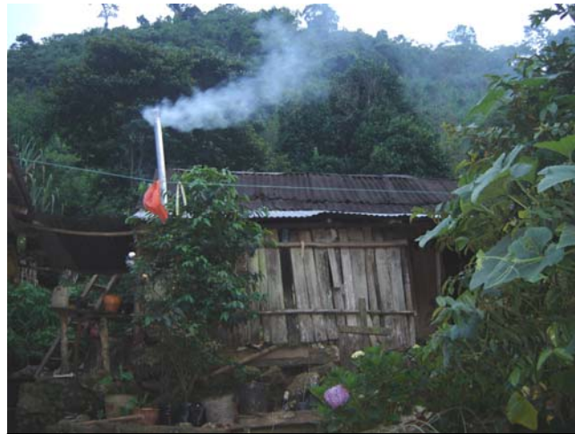
Las estufas ahorradoras de leña expulsan el humo al exterior de la casa, evitando así enfermedades en la familia.

Las estufas ahorradoras de leña propuestas en este proyecto tipo permiten un ahorro sustancial de leña, por lo que pueden contribuir significativamente a disminuir la deforestación y abatir los costos de la cocción de alimentos. Asimismo, con la eliminación del humo de los hogares se mejora la calidad del aire y por ello se ayuda a mantener la salud de las familias campesinas. Ejemplos de esto se pueden observar en comunidades atendidas por el PESA en Puebla, Oaxaca y Michoacán.