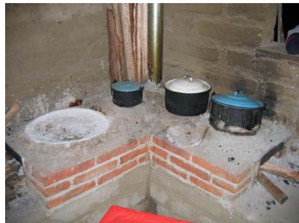
Estufa de dos quemadores hecha de ladrillo y cemento en Tlahuitoltepec, Oaxaca.

La construcción de un número determinado de quemadores y el tamaño de los mismos, está en función del número de integrantes de la familia, la diversidad de alimentos que se consumen, el tamaño del comal y ollas, así como los momentos y tiempos en que se cocinan los alimentos. Por ejemplo si se ponen a cocer los frijoles, entonces se necesita un quemador que no esté conectado con el comal; por esta razón se sugiere que exista un quemador auxiliar con puerta para leña. Con esta adaptación se ha logrado incrementar la adopción en la Sierra Mixte de Oaxaca.