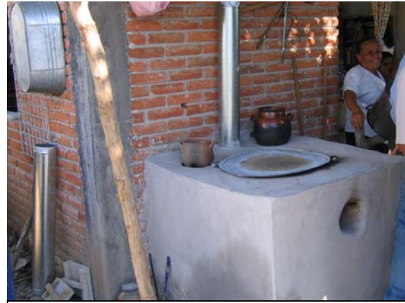
Estufa de bloque en la mixteca poblana

Otro proceso de construcción es el empleado por la ADR Arraigo de la Mixteca en Puebla, cuya técnica consiste en hacer un bloque compacto de forma casi cúbica con una mezcla de arena, barro y cal. Se hace un cajón con tablas de madera de las dimensiones deseadas para la estufa, en el cual uno de sus lados es la pared de la casa. Este cajón se rellena con capas sucesivas de la mezcla que se van compactando y una vez que se alcanza una altura de trabajo cómoda para la señora de la casa, se excava la cámara de combustión y las galerías interiores, con las salidas correspondientes para el comal, dos quemadores y la chimenea. Luego de colocar la chimenea se repella con una mezcla de cemento todo el exterior del bloque.